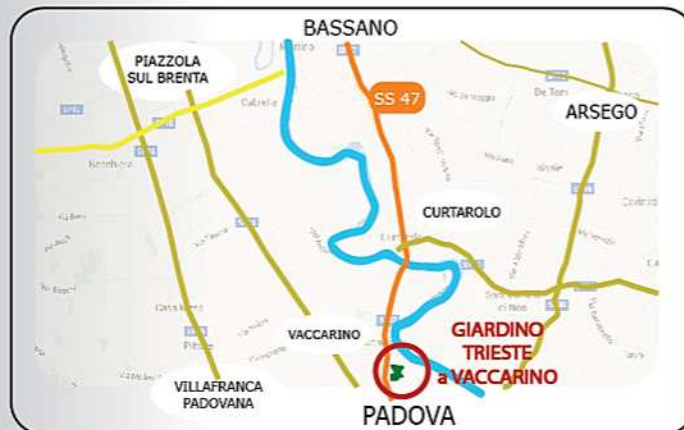
Giardino Trieste - De Benedetti via Padova - Bassano, 59 - Vaccarino di Piazzola sul Brenta (PD)