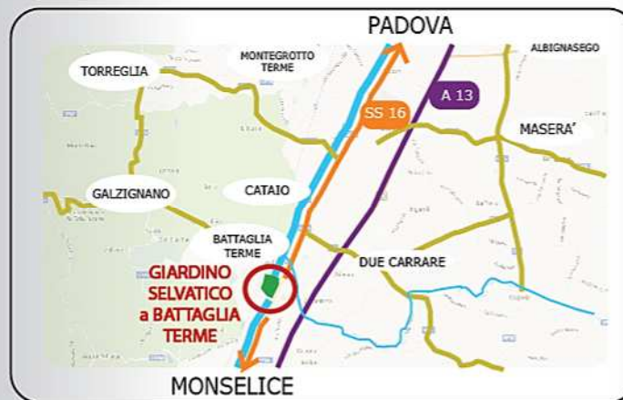
Giardino Selvatico - Meneghini viale Sant'Elena, 36 - Battaglia Terme (PD)