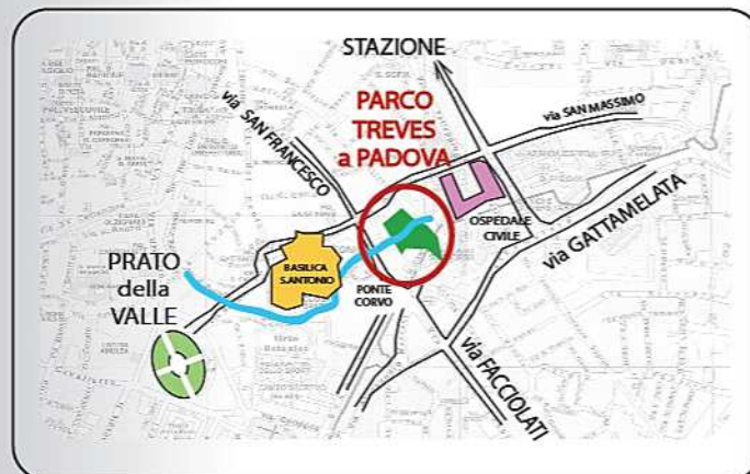
Parco Treves - de' Bonfilli - via Bartolomeo d'Alviano - Padova